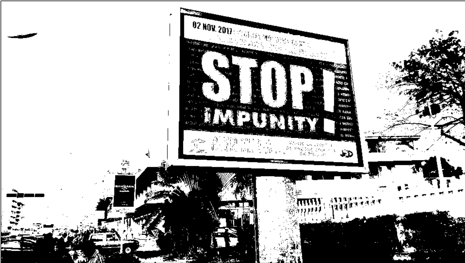
Kinshasa : Des panneaux de sensibilisation implantés par JED sur la campagne de lutte contre l'impunité et pour la sécurisation des journalistes